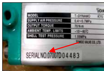
【シリアル番号プレート】